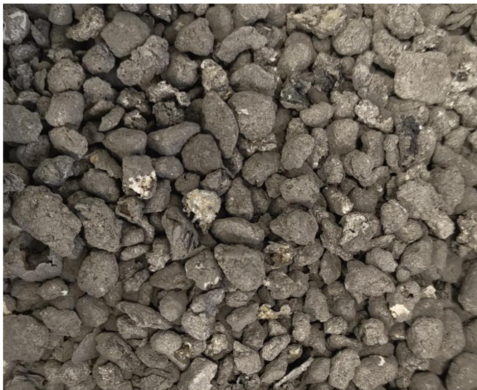
Image 1. Granulés de scories noires obtenus auprès d'un recycleur d'aluminium en Autriche